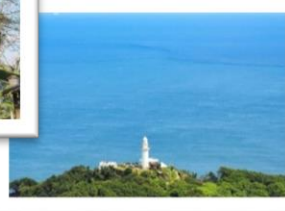
鶴御埼灯台 (つるみさきとうだい)