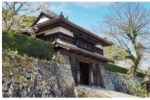
佐伯城址「城山」 三の丸櫓門 (やぐらもん)