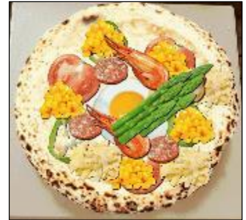
【児童が作成したピザ】

目的意識を持って活動できるように、ゴールの設定を工夫しました。学校行事と結び付けたことで活動に必然性が生まれたとともに、言語活動では、自分のおすすめピザを作るためにピザの具材を集めるという目的意識を持って活動することができました。